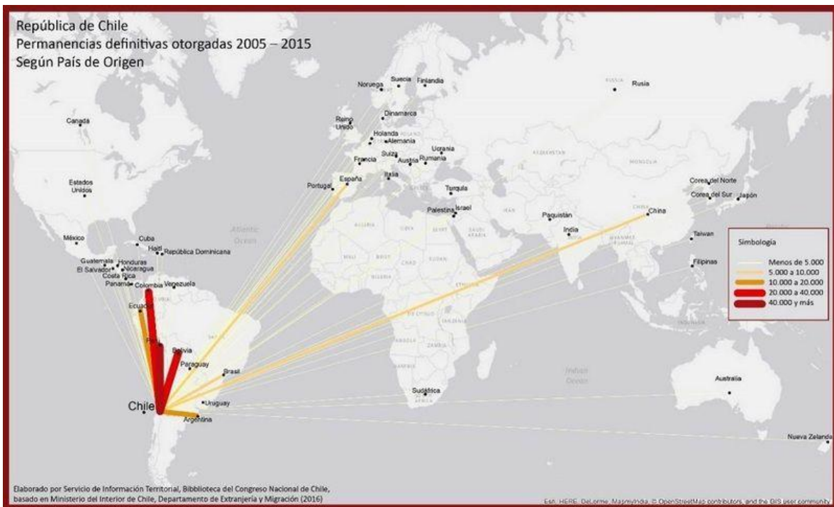
Mapa permanencias definitivas en Chile 2005-2015

La historia migratoria en Chile nos ha demostrado que en nuestro país se generaban emigraciones más que inmigraciones. Hoy, queda a la vista que el fenómeno se ha invertido, a tal grado que en nuestras calles y barrios se logra identificar al foráneo, cuya cultura lo delata y lo evidencia como un sujeto diferente a natural chileno.